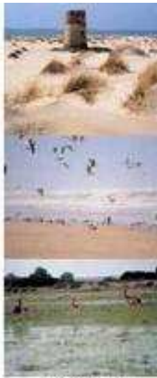
Parque Nacional de Doñana

La única huella humana en 32 kilómetros de playa es Torre Carboneras, una torreón de vigilancia del siglo XVI. Hacia el interior comienzan las dunas y los pinos. En el llamado cerco del trigo se pasó varios años a principios de este siglo el arqueólogo alemán Schuler buscando, sin resultado, la misteriosa ciudad de Tartessos. En Doñana todavía se pueden ver, medio escondidas entre los pinos, chuzas con techo de paja como las que servían de alojamiento a los antiguos habitantes del coto, quienes vivían principalmente de la pesca y de la fabricación de carbón. Al otro extremo del Parque se encuentra el Centro